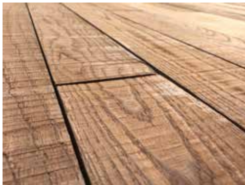
ワイルドな仕上がり感