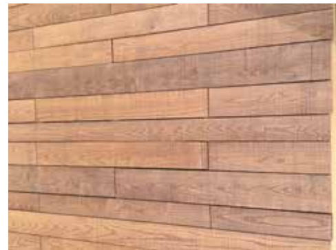
複数の幅で表情のあるレイアウト