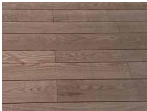
施工後 1 ヶ月経過