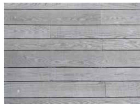
施工後 4.5 ヶ月経過